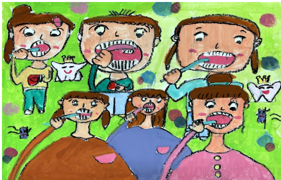
小学校低学年の部