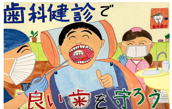
小学校高学年の部